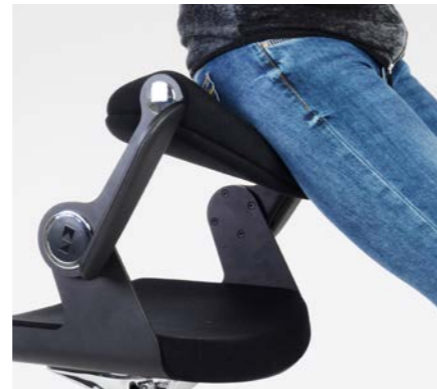
3. SCHRITT: Die Stopp-Funktion der Gasfeder wird bei Belastung automatisch aktiviert und verhindert ein Wegrollen.