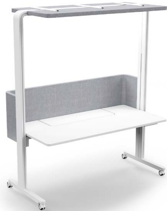
K+N STANDBY.OFFICE 2.0

Persönlicher Rückzugsraum für ungestörte Kommunikation oder zum Abschalten.