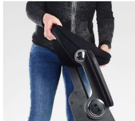
1. SCHRITT: Arm- bzw. Rückenlehne umklappen.