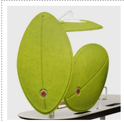
Akustikblatt-Absorber für visuellen und akustischen Schutz