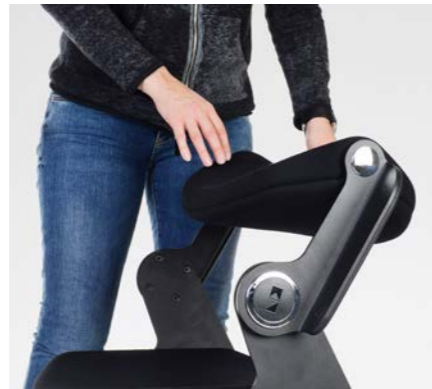
2. SCHRITT: Rückenlehne schwenkt in Stehposition und rastet ein.